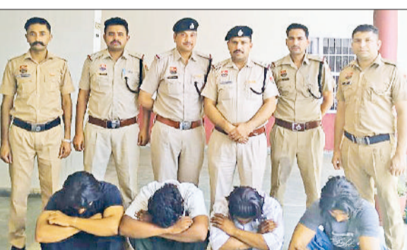
कैथल। थाना चीका पुलिस गिरफ्त में आरोपी।

जिला पुलिस द्वारा अपराधियों के खिलाफ चलाए जा रहे विशेष अभियान के तहत थाना चीका पुलिस ने लूट की वारदात का प्रयास करने वाले गिरोह के 4 आरोपियों को गिरफ्तार करने में सफलता हासिल की है। आरोपियों ने देर रात पटियाला रोड पर एक कार सवार युवकों को रोककर सोने की चैन, कड़ा व नकदी लूटने का प्रयास किया तथा पुलिस नाका पर तैनात कर्मचारियों को कुचलने की