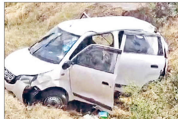
जींद। दुर्घटनाग्रस्त हुई कार।

गति सुबह के समय दस किलोमीटर प्रति घंटा तो दोपहर को 19 किलोमीटर प्रति घंटा तक जा पहुंची। दोपहर बाद अर्धरात्रि बजे तापमान 44 डिग्री पर भी पहुंच गया। हवा का मिजाज भी काफी गर्म हो गया, जिसके चलते सड़कें व बाजार सुनसान दिखाई दिए और दिनचर्या भी प्रभावित हुई। सोमवार 25 मई से एक जून तक नौताप रहेगा। इस समय धरती पर सूर्य की गर्मी सबसे ज्यादा होती है। लिहाजा इस तपती गर्मी और लू से खुद को सुरक्षित रखने के लिए स्वास्थ्य विभाग व प्रशासन द्वारा एडवाइजरी जारी की गई है। प्रशासन ने नागरिकों से अपील की है कि वे दोपहर के समय बेवजह घरों से बाहर न निकलें और स्वास्थ्य विभाग द्वारा जारी दिशा-निर्देशों का पूरी निष्ठा से पालन करें ताकि हीट वेव के दुष्प्रभावों से बचा जा सके। लू के कारण शरीर में पानी की कमी, चक्कर आना और हीट स्ट्रोक जैसी गंभीर समस्याएं पैदा हो सकती हैं। विशेष रूप से बच्चों, बुजुर्गों, गर्भवती महिलाओं और पहले से बीमार व्यक्तियों के प्रति अधिक सावधानी बरतने की सलाह दी गई है।