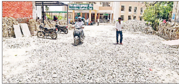
जींद। नागरिक अस्पताल में कचरावा जा रहा रास्ता निर्माण कार्य।

जिला मुख्यालय स्थित नागरिक अस्पताल में 14.91 करोड़ रुपये की लागत से चल रहे रेनोवेशन कार्य बेहद धीमी गति से आगे बढ़ रहे हैं। इस समय मुख्य रास्ते पर ब्लॉक उखाड़ कर इस पक्का करने का काम किया जा रहा है। गत एक सप्ताह से यहां कार्य जारी है। न तो यहां पर पानी का छिड़काव किया जाता है और न ही कार्य में तेजी लाई जा रही है। जिसके चलते दिनभर यहां धूल उड़ती रहती है जो अस्पताल आने वाले मरीजों व उनके तैयारियों के लिए परेशानी का सबब बना हुआ है।