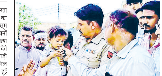
कैथल। बच्चे को खाना खिलाते पुलिस कर्मचारी।