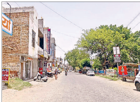
जींद। दोपहर के समय खाली नजर आ रहा सफरीदों रोड।

लगातार सूर्य देवता के आग उगलने तथा 19 किलोमीटर प्रति घंटा की स्पीड से चली हवा के गर्म थपड़ों ने रविवार को लोगों को घरों में दुबकने को मजबूर कर दिया है। रविवार को अधिकतम तापमान चार डिग्री बढ़ कर 44 डिग्री पर पहुंच गया व न्यूनतम तापमान तीन डिग्री बढ़ कर 31 डिग्री दर्ज किया गया। मौसम में आद्रता 14 प्रतिशत व हवा की गति 19 किलोमीटर प्रति घंटा दर्ज की गई। दिनभर चली गर्म हवाओं ने आमजन को बेहाल करके रख दिया। वहीं चिकित्सकों ने लोगों को सलाह दी है कि तेज धूप में घर से बाहर न निकलें और ज्यादा से ज्यादा स्वच्छ पेय पदार्थों का प्रयोग करें। मौसम वैज्ञानिक डा. राजेश ने बताया कि आगामी