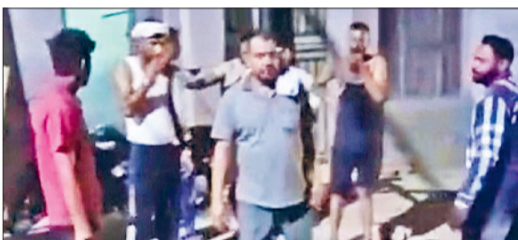
राजौद। गांव सेरधा में टूटी सड़क के विरोध में रात को प्रदर्शन करते ग्रामीण।