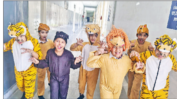
कैथल। इंडस पब्लिक स्कूल के विद्यार्थी वन्य जीवों का मुखौटा पहने हुए।