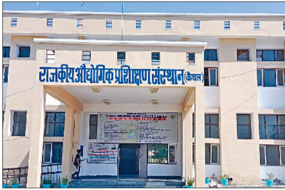
कैथल। आईटीआई का भवन।